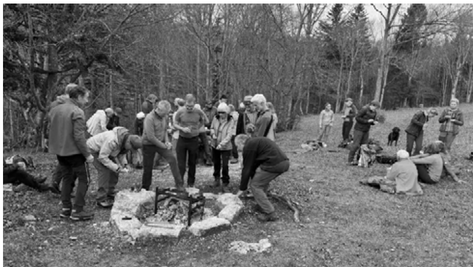
Apéro beim Chänzli