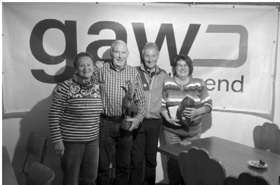
Siegerfoto SAC-Jass Sektion Weissenstein 2025

Für die Skitourenwoche sind noch 2 Plätze frei geworden. Bei Interesse meldet Euch bei Rolf Fortmann 079 359 67 78, per Mail an rolf.fortmann@bluewin.ch oder auf Droptours. Für Fragen steht Rolf gerne zur Verfügung.