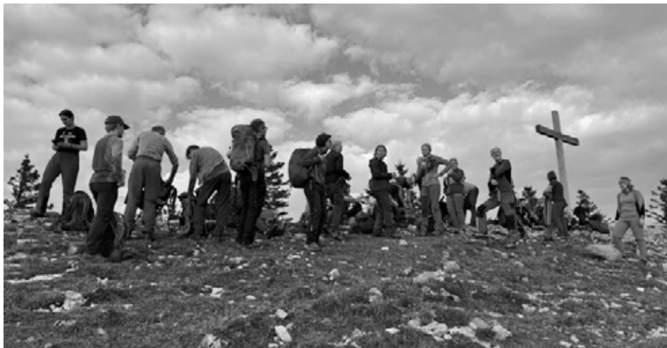
Gipelfoto der Schlusstour