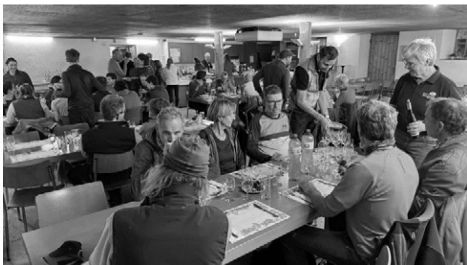
Essen im Sennhaus